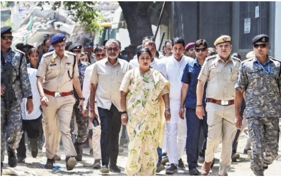
अन्य एजेंसियों द्वारा संयुक्त रूप से राहत एवं बचाव कार्य किया जा रहा है। मुख्यमंत्री रेखा गुप्ता ने विभिन्न

अधिकारियों ने मुख्यमंत्री को बताया कि राष्ट्रीय आपदा मोचन बल (एनडीआरएफ), दिल्ली अग्निशमन सेवा, दिल्ली पुलिस, जिला प्रशासन, दिल्ली आपदा प्रबंधन प्राधिकरण (डीडीएमए), सिविल डिफेंस और